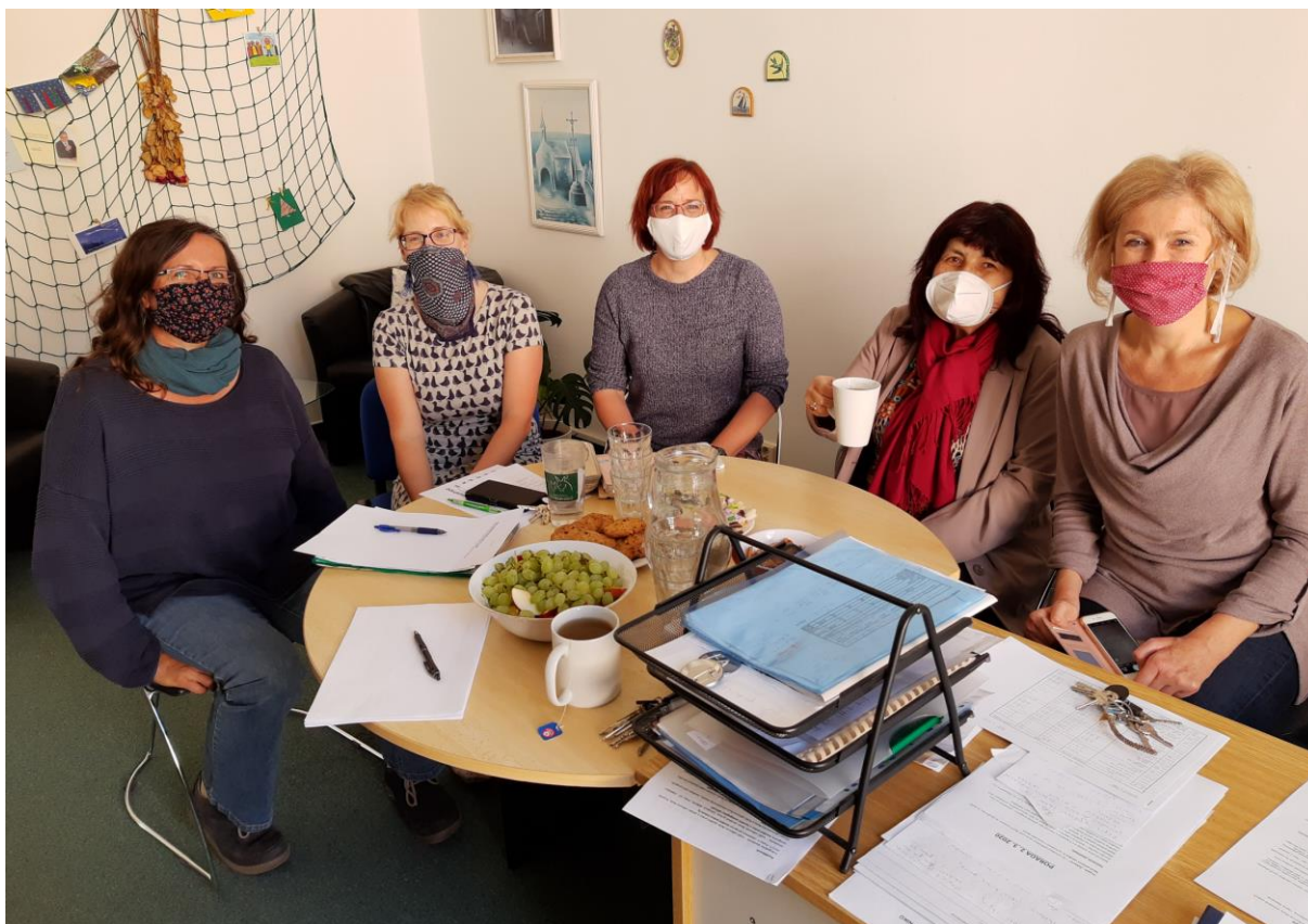
Průběh provozních porad byl ve školním roce 2019/2020 komplikován hygienickými opatřeními – přesto panovala výborná atmosféra

Se všemi vyučujícími se vídáme na pedagogických poradách a při neformálním předvánočním obědu. Bohužel se letos nepodařilo kvůli epidemii COVID-19 zorganizovat setkání s emeritními pracovnicemi EA.