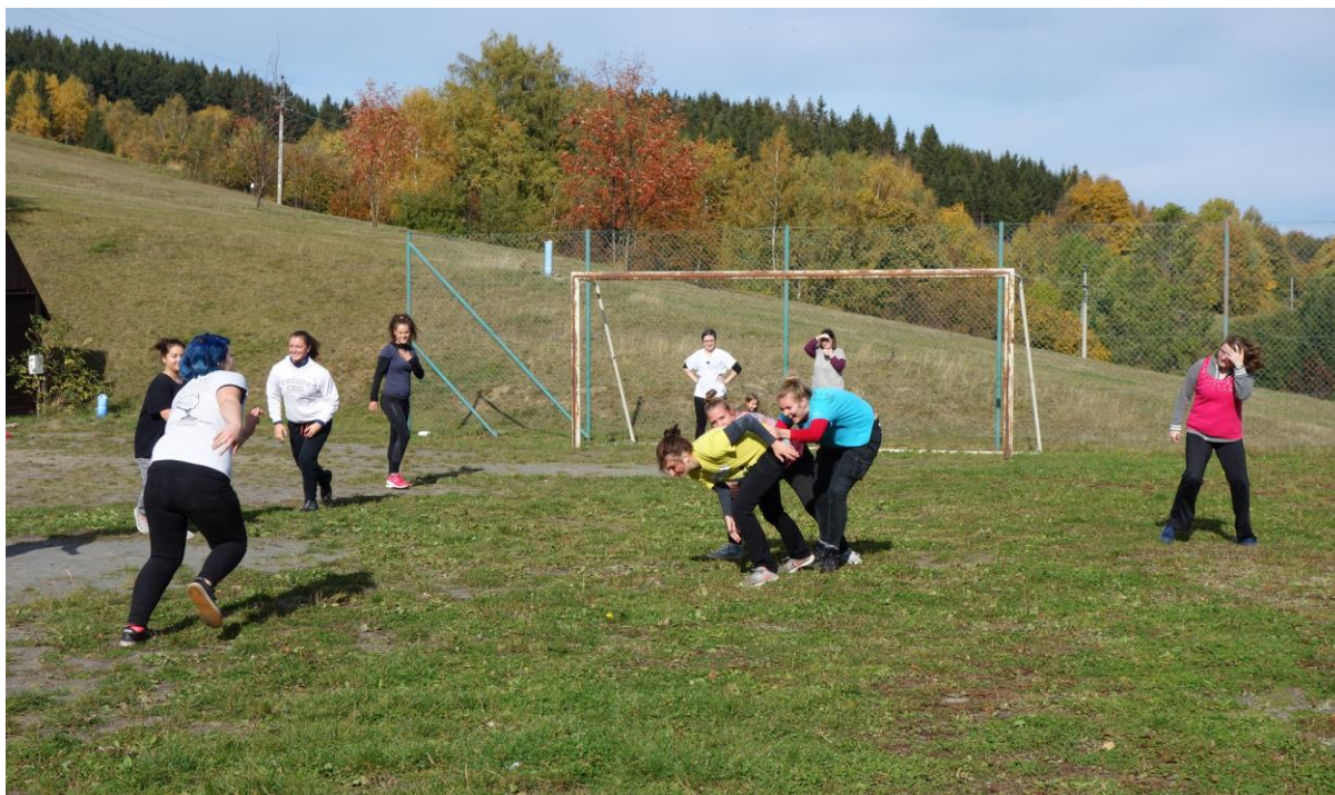
Adaptační aktivity prvního ročníku v říjnu 2019