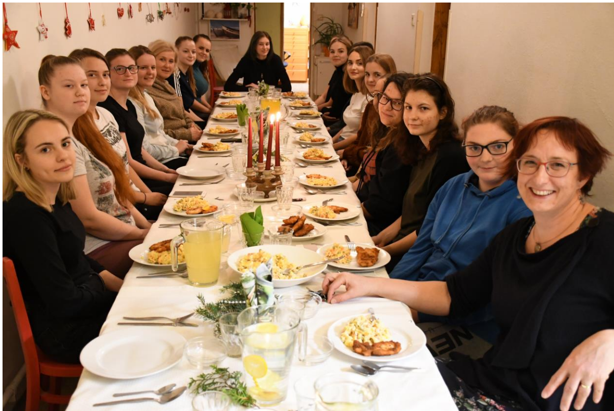
Vánoční slavnost v domově mládeže v prosinci 2019

V kroužku vaření se studentky podílely na přípravě společných večeří. Dívky samostatně naplánovaly, nakoupily a uvařily. Vychovatelka byla vždy nápomocna jak s vytvořením rozpočtu, tak praktickými radami. V předvečer vánočních svátků byla již tradičně na internátě pořádána vánoční slavnost s malým kulturním programem. Studentky se podílely na přípravách večeře a samostatně připravily kulturní program. Akce se zúčastnili i učitelé ze Střední zdravotní školy EA a z EA VOŠ sociálně právní.