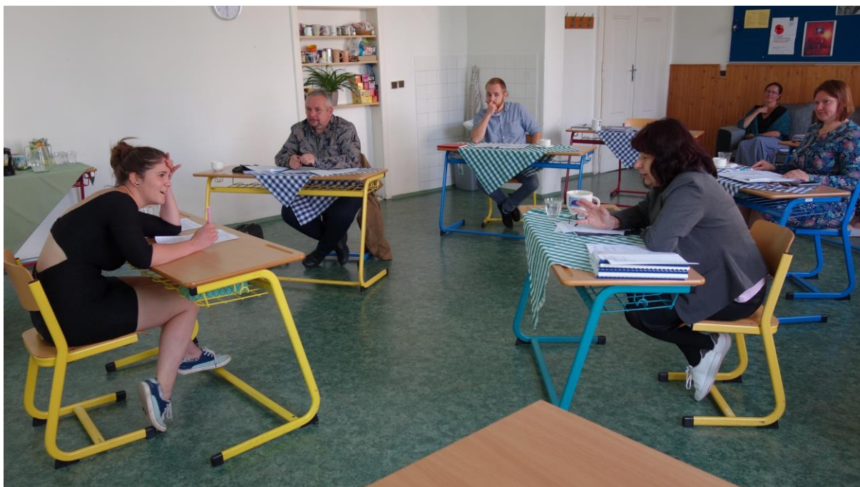
Sociální distance během absolutoria v červnu 2020

Nepříjemnou a bezprecedentní komplikací školního provozu byla pro naši školu – jako ostatně pro všechny školy v ČR – epidemie viru, který způsobuje onemocnění COVID-19. Od 12. března do konce května se naši studenti nesměli účastnit prezenční výuky. Teoretická výuka ve škole byla nahrazena distanční výukou, která zahrnovala jak online výuku v prostředí MS Teams, tak i samostudium elektronicky dodaných materiálů. Platforma MS Teams byla hojně využívána také k neformálnímu setkávání vyučujících a studentů, ke konzultaci absolventských prací a k pedagogickým a provozním poradám. Odbornou praxi studenti absolvovali podle možností buď během letního období, pokud to situace v sociálních institucích dovozovala, nebo pak o prázdninách. Naštěstí byla epidemiologická opatření zmírněna v červnu, takže mohlo prezenční formou proběhnout absolutorium třetího ročníku i přijímací pohovory uchazečů o studium.