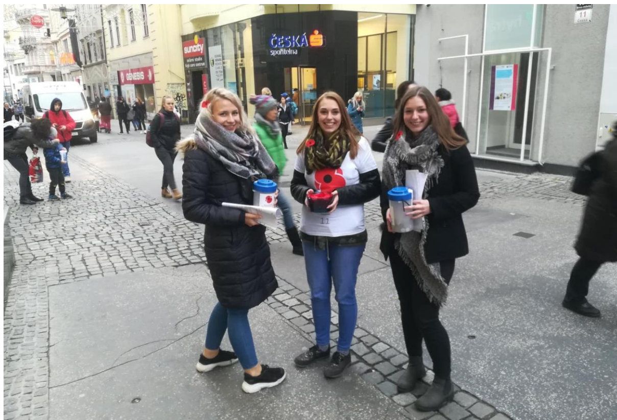
Studentky druhého ročníku při sbírce pro Paměť národa (Den válečných veteránů)

asistence u dětí z rané péče. Výtěžek z prodeje různých vlastních výpěstků, pochutin, ovčích nohou a výrobků dohromady se sbírkou z adventní bohoslužby Střední zdravotnické školy Evangelické akademie v Brně Líšni činil téměř 14 000 Kč. Podílet se na takovýchto akcích je velká radost. Naši studenti jsou skvělí a jsme na ně velice hrdí. Během podzimu a zimního období se opětovně zapojili i do dalších projektů se sociální a charitativní tematikou (Koláč pro hospic, Den válečných veteránů – sbírka pro Paměť národa, Světový den Downova syndromu, Světový den autismu, Den Jom-ha-šoa, Krabice od bot ad.).