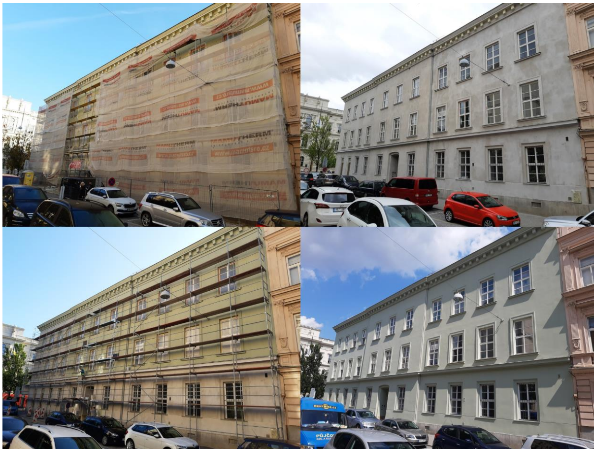
Průběh rekonstrukce fasády na Opletalově ulici č. 6 ve školním roce 2022/2023

Ve školním roce 2022/2023 získala budova, ve které sídlí i naše škola, novou fasádu. Na podzim byla odstraněna špatná omítka a nahozena nová. Na jaře pak dělníci postavili lešení podruhé, aby celý dům natřeli na tradiční zelenou barvu. Odstín zelené tentokrát lépe odpovídá historickému charakteru budovy. Děkujeme vedení sboru ČCE Brno 1 za realizaci této rekonstrukce i za to, že omezení našeho školního provozu bylo minimální.