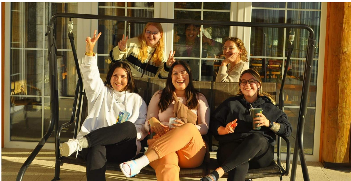
Studentky naší školy na pobytu ve Strážovicích v září 2022

Během školního roku se konaly i jiné akce, při kterých měli studenti možnost strávit spolu společný čas, lépe se poznat a prohlubovat vzájemné vztahy. Před Vánocemi proběhl tradiční dobročinný jarmark, o němž podrobněji referuje školní kaplanka na jiném místě.