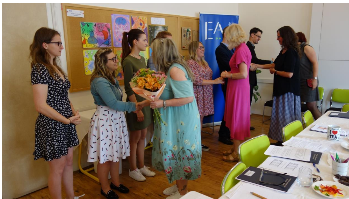
Absolutorium třetího ročníku se konalo v červnu 2023

Výsledky absolutoria ve školním roce 2022/2023