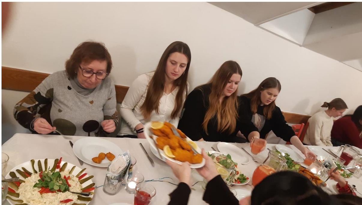
Společná večeře se studenty, pedagogy a vychovatelkami v DM

V prosinci 2022 se uskutečnila tradiční předvánoční večeře s vedením školy a vyučujícími. Studentky se aktivně podílely na přípravě a kulturním programu. Učitelé tak měli možnost poznat prostředí a atmosféru našeho domova.