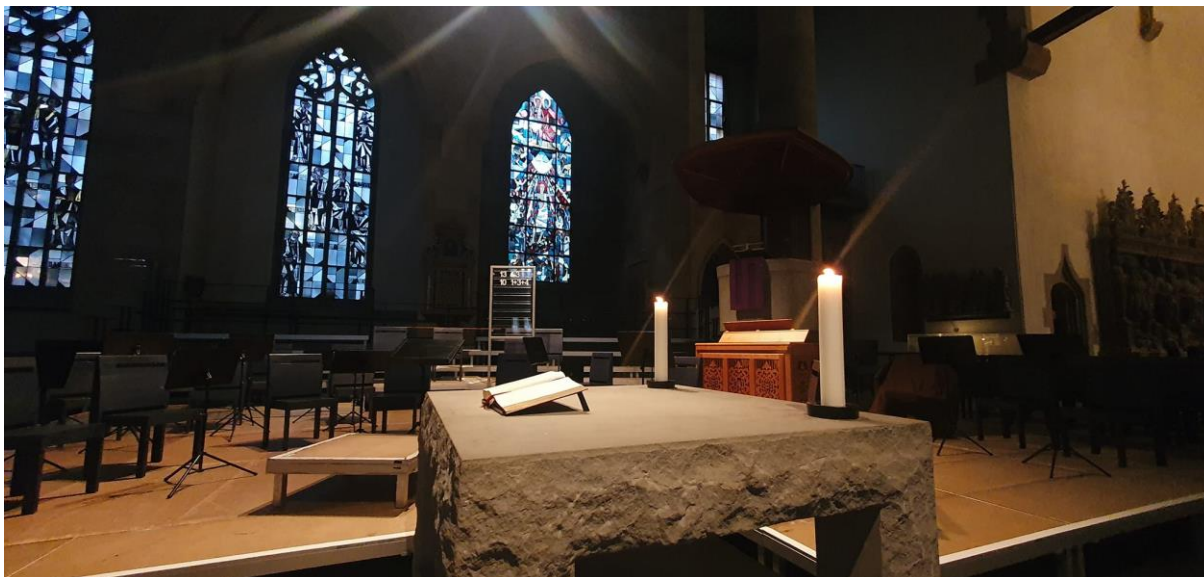
Se studenty jsme ve Stuttgartu navštívili také tamní Stiftskirche

Na začátku adventu jsme po covidové pauze opět mohli vyjet se druháky na týdenní studijní pobyt do Stuttgartu. Tento intenzivní čas je nabitý jak spoustou nových informací, zážitků a pohledů na sociální práci, tak podvečerních individuálních rozhovorů, chvilích zábavy i ticha. Ocitnout se v čase a prostoru s jiným rytmem, než je jen ten školní, je občerstvující. Jak pro studenty, tak pro mne. A jsem za tuto možnost velmi vděčná.