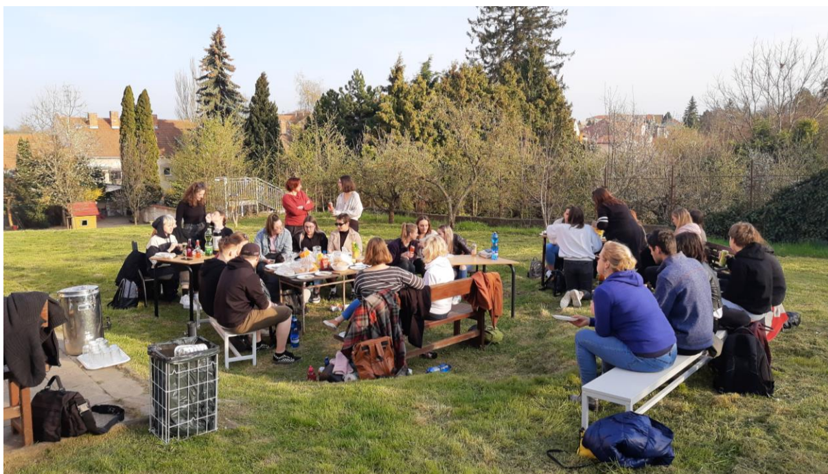
Neformální setkání studentů a vyučujících při grilování na zahradě SZŠ EA, duben 2023

Naši pedagogové obvykle sami ze svého zájmu usilují o profesní růst formou dalšího vzdělávání, které buď souvisí s jejich profesí mimo školu, anebo souvisí přímo s výukou u nás (např. supervizní výcvik pro potřeby naší školy). Využívají pochopitelně také systém DVPP. Ve školním roce 2022/2023 jsme uplatnili na další vzdělávání zejména finanční prostředky ze strukturálních fondů, konkrétně z tzv. Šablon (OP JAK). Nepedagogická pracovníce (hospodářka) absolvovala několik školení (spisová služba, pokladna aj.).