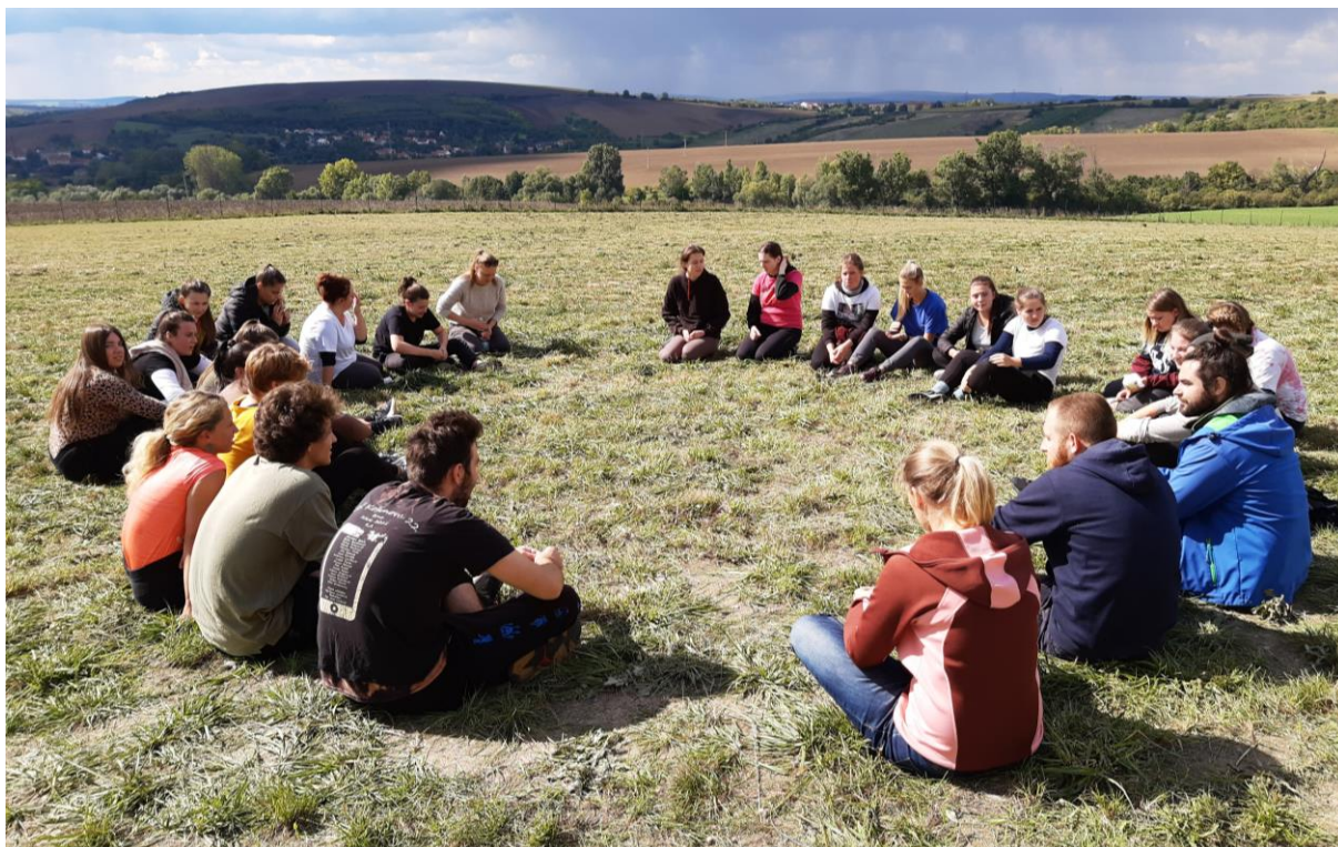
Studenti prvního ročníku při adaptačních aktivitách, září 2022

Počty studentů ve školním roce 2022/2023