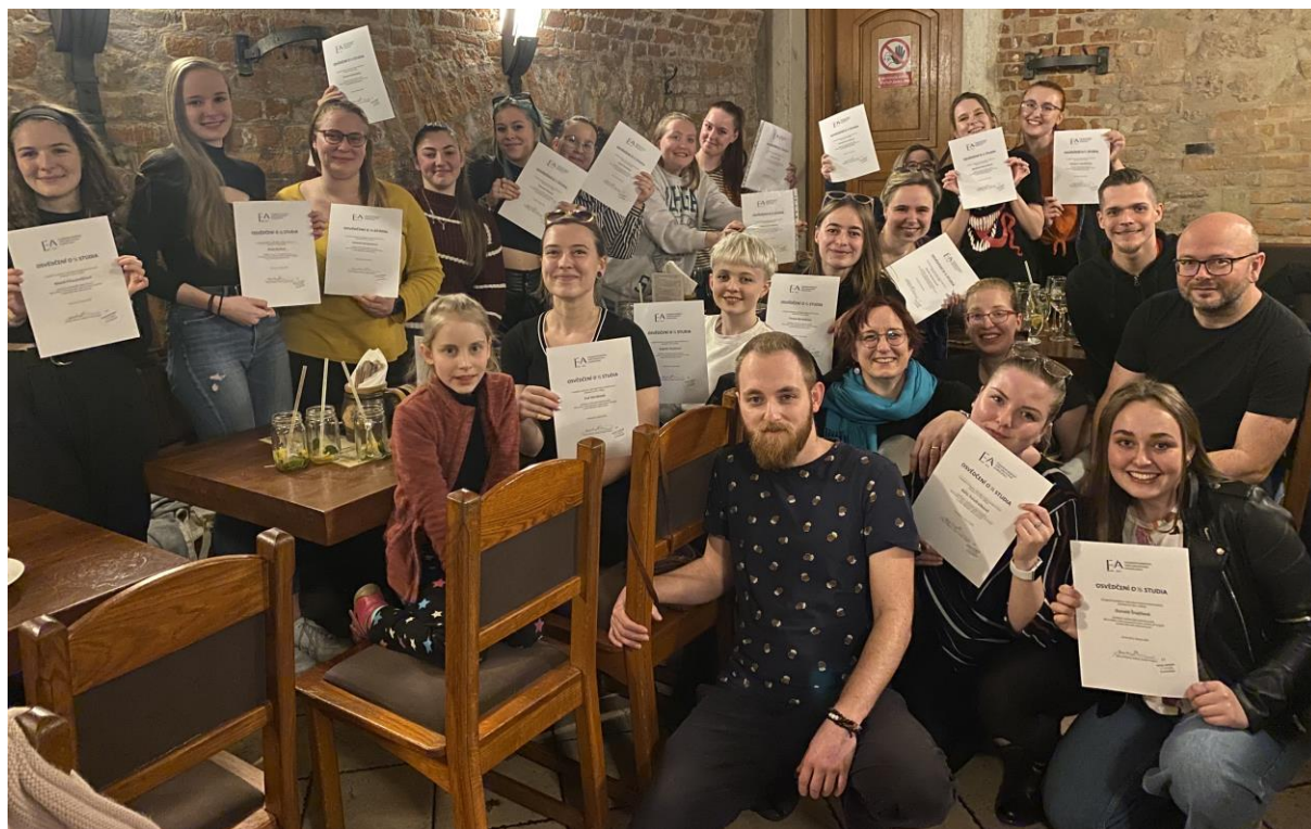
Studenti druhého ročníku s certifikáty o absolvování poloviny studia na EA

Na začátku letního semestru se například konala oslava poloviny studia pro studenty druhého ročníku, při které se mimo jiné dozvěděli, jak vypadá sociální práce dělaná na polovic... Na jaře se zase uskutečnilo neformální setkání v zahradě Střední zdravotnické školy EA, kde se u společného grilování sešli studenti všech tří ročníků a vyučující.